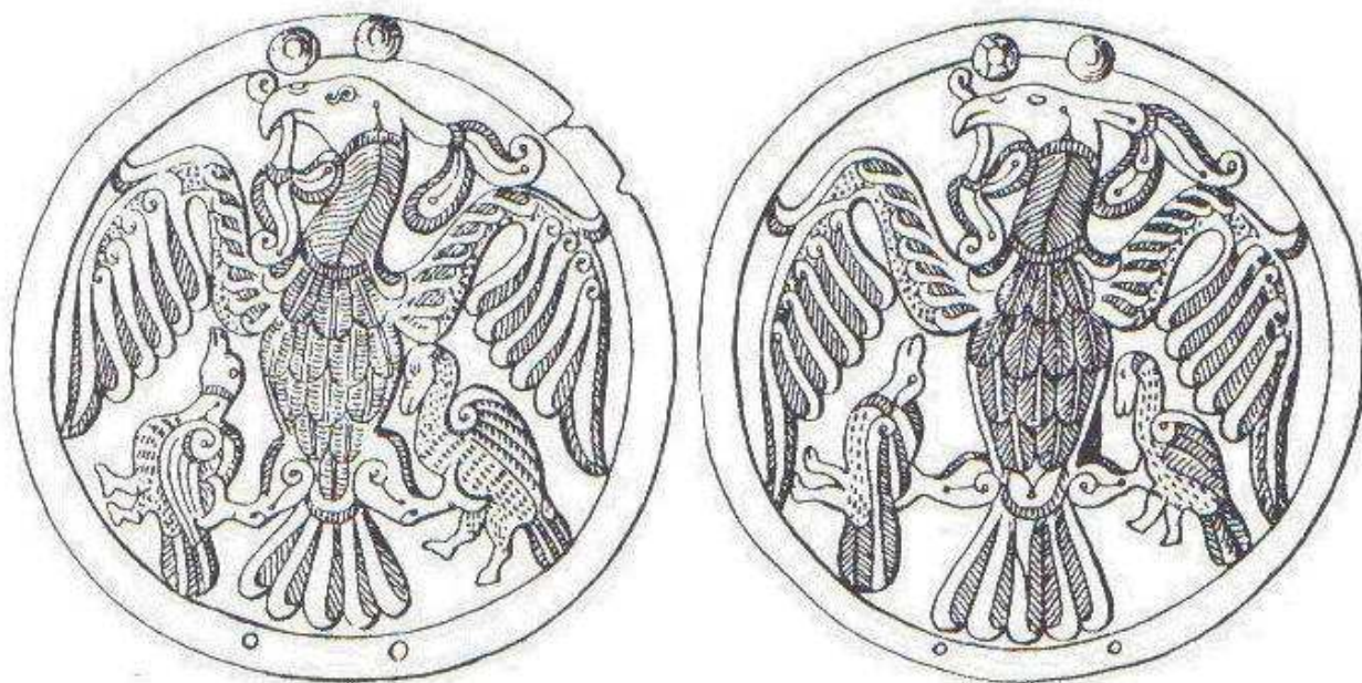
4. ábra A rakamazi korongpár turul 7 ábrázolása (Az eredeti korongok ezüsből készültek, melyet aranyveret díszít.)