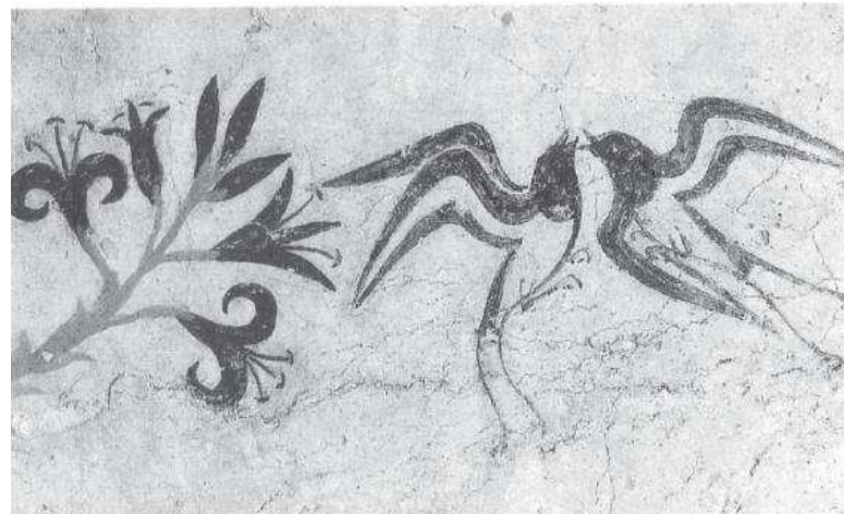
1. ábra Fent: Emuhoz hasonló madáralak Ausztráliából.

(Középen és lent: Tőkés réce hímje és füsti fecskék ábrázolása Krétáról.)