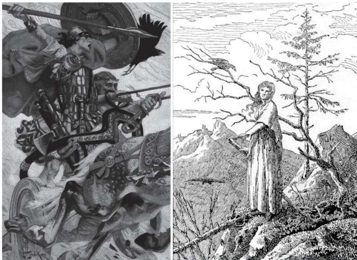
3. ábra Kelta mitológiai alakok. A bal oldali kép Cúchulainn-t ábrázolja Morrigan istennővel (holló képében) az oldalán, Joseph Leyendecker alkotása, 1911.

Az alakváltások is igen gyakoriak voltak, mind az istenek, mind a hősök körében. Ezek az átváltozások támadó és védekező szerepet is betöltöttek. Az egyik történet szerint Llew Llaw Gyffes, egy wales-i hős, úgy menekült meg egy orvgyilkosság elől, hogy sássá változott, mely alakban képes volt elrepülni.